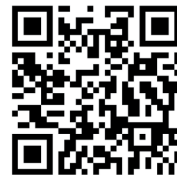
專上課程電子預先報名 平台 (E-APP)